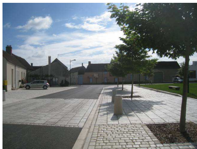
Photos 23 et 24 : L'église Saint-Aignan/Saint-Roch est implantée au cœur du village, au sein d'une placette rénovée (IEA)

Le bâti se compose à la fois des habitations anciennes, traditionnelles, et de constructions pavillonnaires récentes placées sur les extérieurs.