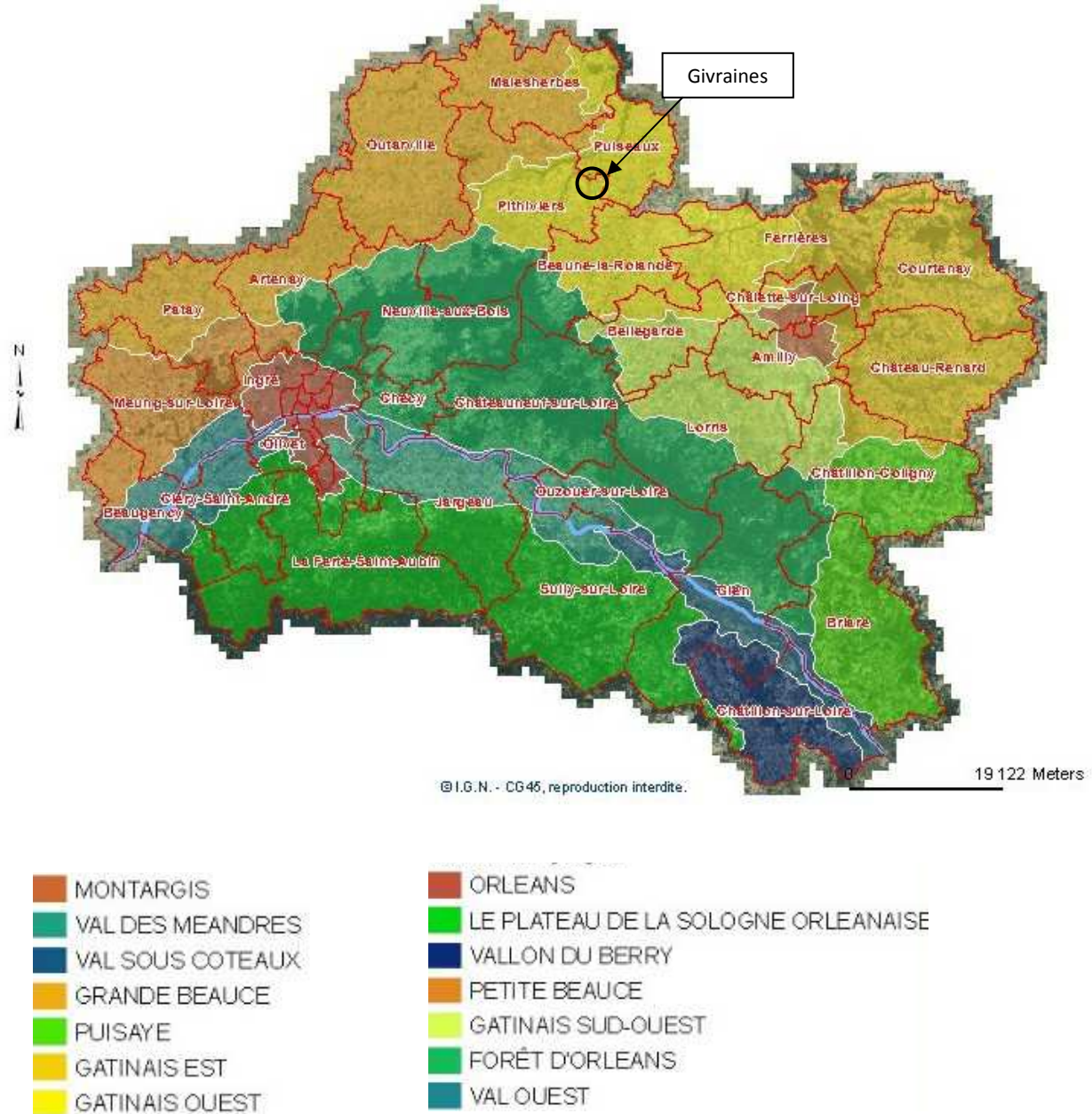
Figure 11 : Les ensembles paysagers du Loiret

A l'échelle du Loiret, la commune de Givraines appartient à l'ensemble paysager "Gâtinais Ouest".