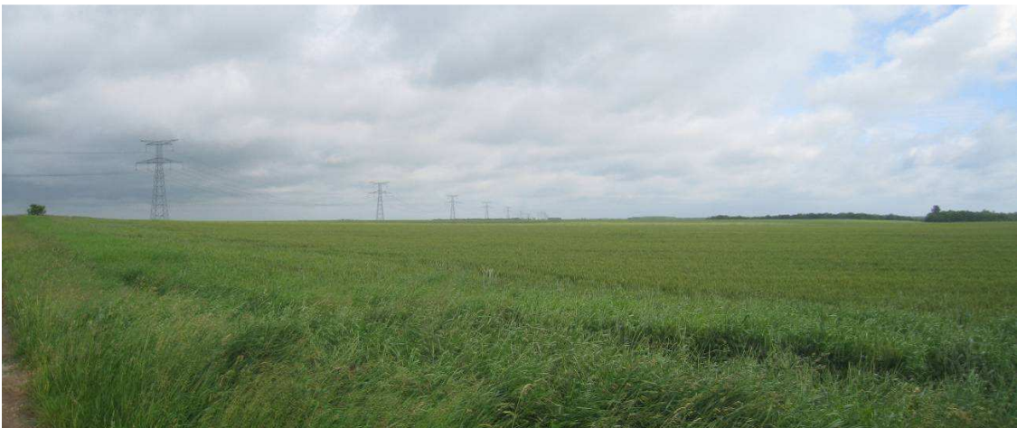
Photo 12 : La ligne électrique est perceptible sur une très longue distance

La configuration plane du territoire permet de distinguer sur de longues distances les éléments du paysage : lignes électriques, profil des bourgs, château d'eau, etc.