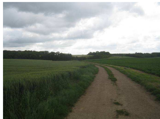
Photos 18 et 19 : Naissance de la vallée sèche au niveau de la RD 112 où une maison s'est implantée, et plus au Sud au sein de la vallée Bourgogne (IEA)