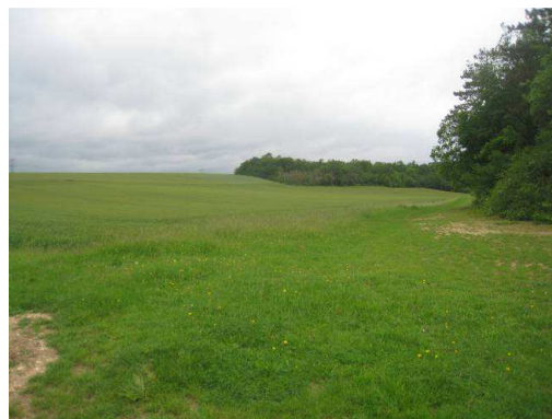
Photos 14 et 15 : La vallée d'Or depuis la RD 25 et au cœur de celle-ci