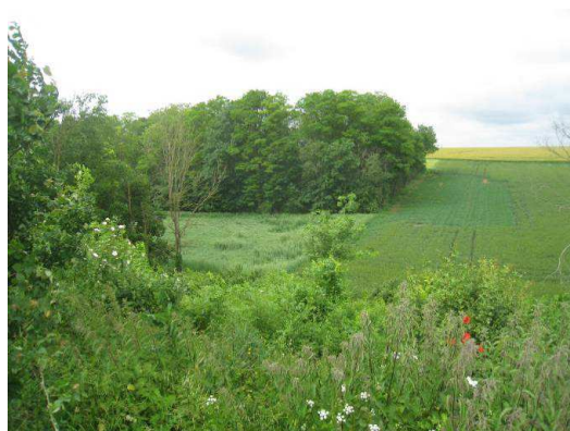
Photos 16 et 17 : Illustration de paysages vallonnés au niveau du Bois Bourdeaux

Ce milieu constitue un ensemble paysager de grande qualité à l'échelle du territoire communal et mérite d'être préservé de toute urbanisation. Jusqu'à présent, seules trois maisons se sont implantées au sein de cette vallée, au niveau du château d'eau et de la sortie Est du bourg de Givraines.