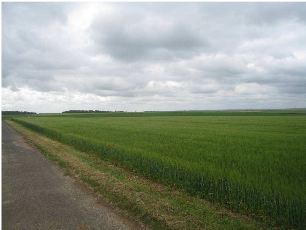
Photo 10 : Un plateau agricole offrant de larges perspectives (IEA)

Les plateaux agricoles constituent l'élément paysager principal de Givraines. Ils occupent de vastes espaces et, du fait de la quasi absence de relief, offrent de grandes perspectives vers l'horizon.