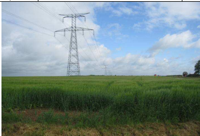
Photo 43 : Ligne électrique passant à l'Ouest du territoire de Givraines (IEA)

D'autres servitudes (non déclarées d'utilité publique) peuvent être listées :