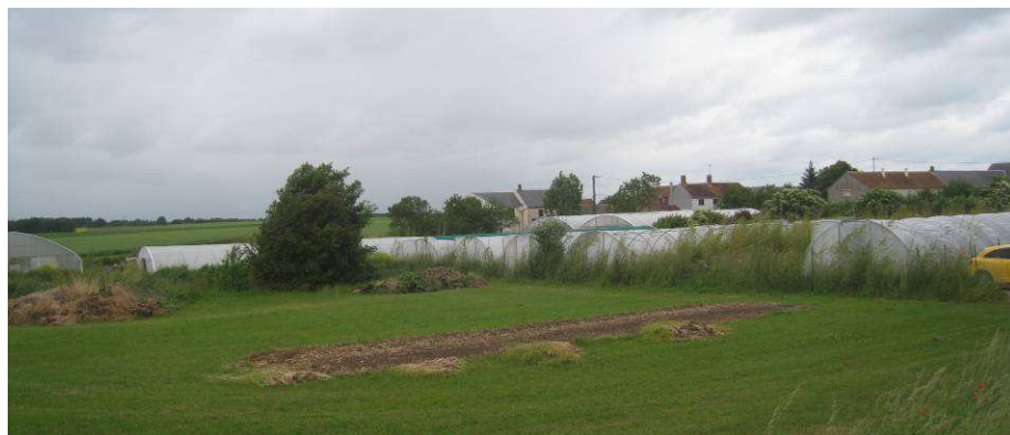
Photo 42 : Pépinière "le Châtel des Vivaces" à l'entrée d'Intvilliers (IEA)

La commune a fait l'objet d'un remembrement en 2009.