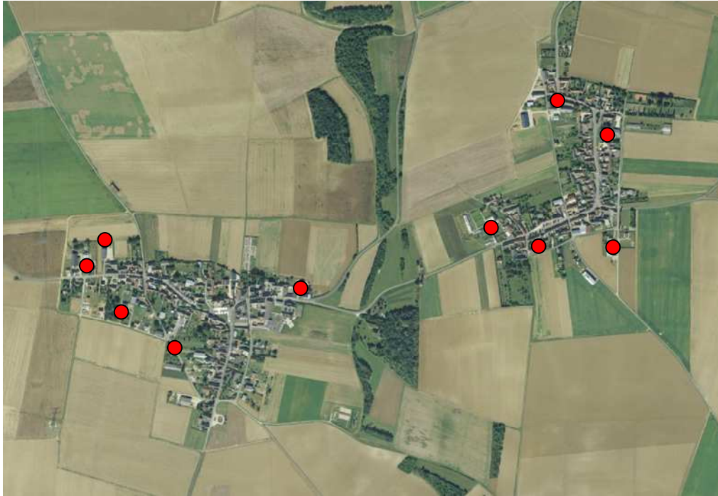
Figure 15 : Localisation des sièges d'exploitations (fond cartographique IGN)